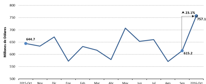
BALANZA COMERCIAL DEL SECTOR AGROPECUARIO