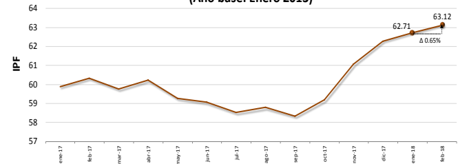
Índice de Precios de Fertilizantes Nacional (Año base: Enero 2013)

El comportamiento de los precios de fertilizantes, reflejado en el Índice de Precios de Fertilizantes (IPF 2 ) incremento a 63.12. Los precios promedio ponderados de los fertilizantes aumentaron en 0.65% respecto al mes anterior, la tendencia similar a la que se registro en enero y febrero 2017