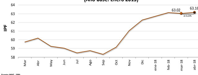
Índice de Precios de Fertilizantes Nacional (Año base: Enero 2013)

El comportamiento de los precios de fertilizantes, reflejado en el Índice de Precios de Fertilizantes (IPF 2 ) aumento a 63.16. Lo que representó que los precios promedio ponderados de los fertilizantes incrementaran en 0.22% respecto al mes anterior. Esta tendencia es similar a la registrada entre marzo y abril del año 2017, que presentó una similar tendencia.