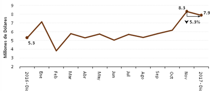
ZONA 7: CRÉDITO PÚBLICO PARA EL SECTOR AGROPECUARIO

Como se mencionó al inicio, la banca pública entregó a la Zona Administrativa No. 7 USD 7.87 millones, lo que representó una disminución de 5% respecto al mes pasado; sin embargo, al cotejar con diciembre del año pasado, ascendió 49%. En cuanto al número de beneficiarios, se reportó una variación positiva del 8% respecto al mes pasado; mientras que al comparar con diciembre del 2016, el comportamiento aumentó 27%.