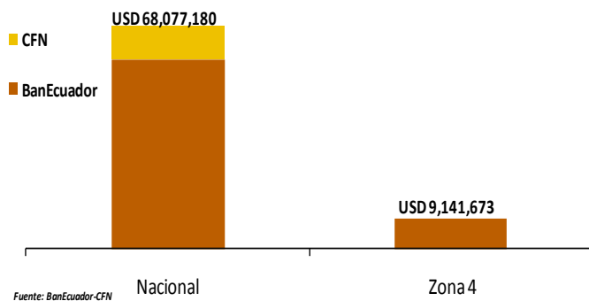
ZONA 4: CRÉDITO PÚBLICO PARA EL SECTOR AGROPECUARIO ESTRUCTURA DE PARTICIPACIÓN-ENERO/2018

En la provincia de Santo Domingo de los Tsáchilas, en el volumen de crédito se registró una variación de -16% al compararla con el mes anterior; del crédito ofertado en la provincia (USD 1 millón), el 68% fue colocado a una tasa de interés del 11% anual, destinado a los sectores de cultivos agrícolas (banano y plátano, piña y pimienta) y de ganadería bovina (ganado de leche) en el cantón Santo Domingo; el 26% del monto se otorgó al 9.76% anual, destinado para el sector de mejoras territoriales, en el cantón de Santo Domingo, según datos de BanEcuador. La diferencia fue colocada a distintas tasas.