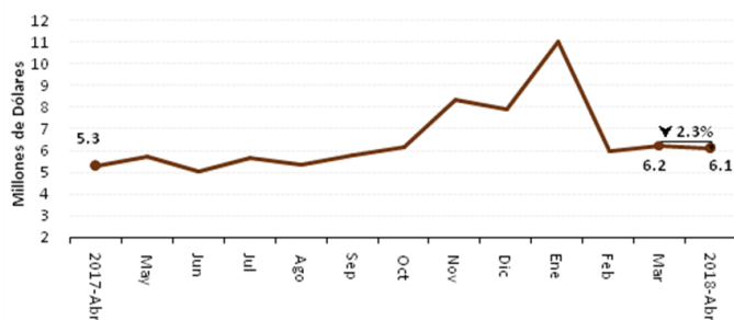
ZONA 7: CRÉDITO PÚBLICO PARA EL SECTOR AGROPECUARIO

Como se mencionó inicialmente, la banca pública entregó a la Zona Administrativa No. 7 USD 6.08 millones, lo que representó un descenso del 2 % respecto al mes pasado; sin embargo, al cotejar con abril del año pasado, ascendió 15 %; en cuanto al número de beneficiarios, se reportó una variación negativa del 14 % respecto al mes pasado; que, al compararlo con abril de 2017 el comportamiento aumentó 51 %.